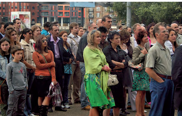
Matei Bejenaru: „Împreună/Together“, performance, Tate Modern London, 2007

La 20 de ani de la înființare, KulturKontakt Austria vă propune o expoziție retrospectivă cu artiștii români care au beneficiat de-a lungul timpului de programul de rezidențe al organizației. Momentul aniversar aduce în mod implicit în discuție schimbările politice și culturale marcate în '89 de căderea zidului Berlinului. Diferențele au fost anulate. Nu mai există „noi“ și „ei“, iar granițele politice și comunicaționale au fost șterse de pe hărți. Dar în ce măsură individul/artistul mai poate fi el fără a fi integrat și înregimentat? În ce măsură își poate trasa limite și își poate demarca personalitatea? Nu e nevoie oare de construirea unor granițe individuale în sensul autodefinitiv al unui „eu“ original în acest mult prea unificator „noi“?