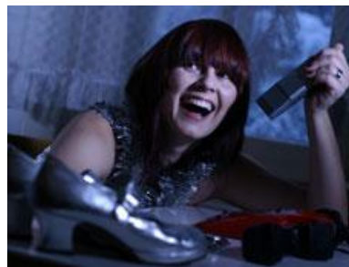
stânga: © Matija Schellander dreapta © Aljosa Korencan

ansamblul ei Mikado, a susținut mai multe concerte în străinătate.